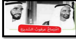
اجتماع عرقوب الشديرة