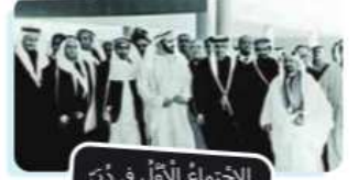
الاجتماع الأول في دبي