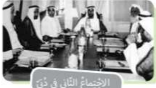
الاجتماع الثاني في دبي