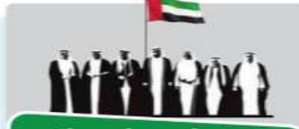
قيام دولة الإمارات العربية المتحدة في 2 من ديسمبر عام 1971 م