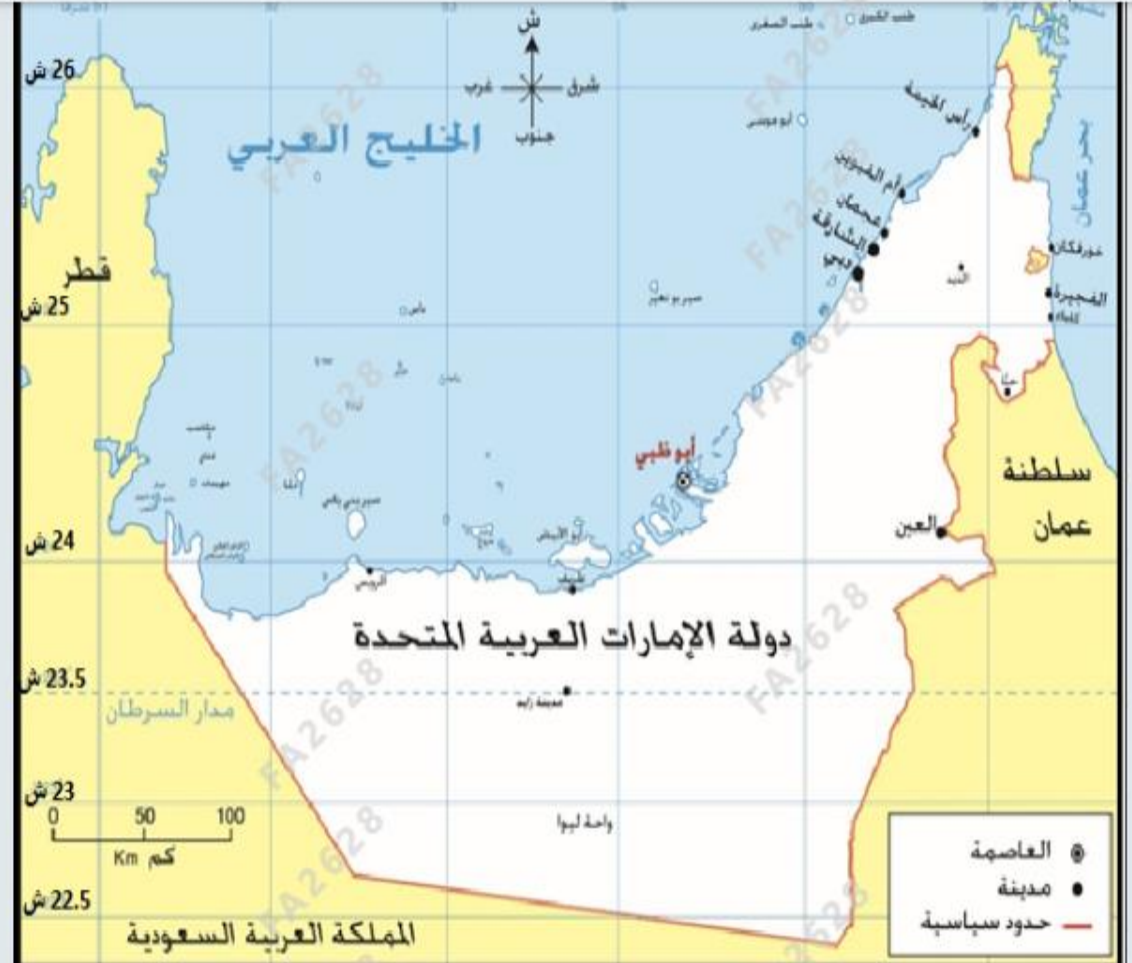
خريطة دولة الإمارات العربية المتحدة