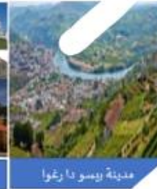
مدينة بيسو دا ريفوا

1. منذ زمن بعيد كان الناس يقطعون بعض مراحل الرحلة من مدينة (بورتو) إلى مدينة (بيسو دا ريفوا) الحافلة، وتغصها بالقطار بحسب التضاريس.