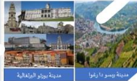
مدينة بورتو البرتغالية