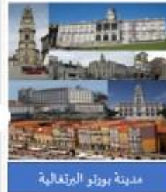
مدينة بورتو البرتغالية