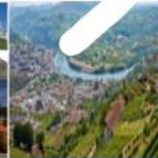
مدينة بيسو دا رغو

1. منذ زمن بعيد كان الناس يقطعون بعض مراحل الرحلة من مدينة (بورتو) إلى مدينة (بيسو دا رغو) الحافلة، وتغصها بالقطار بحسب التضاريس.