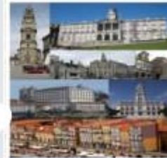
مدينة بورتو البرتغالية