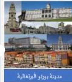
مدينة بورتو البرتغالية