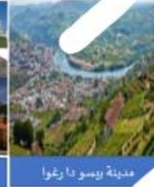
مدينة بورتو البرتغالية