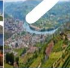
مدينة بيسو دا رغو

1. منذ زمن بعيد كان الناس يقطعون بعض فترات الرحلة من مدينة (بورتو) إلى مدينة (بيسو دا رغو) الحافلة، وتغضبها بالقطار بحسب التضاريس.