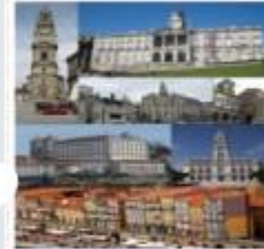
مدينة بورتو البرتغالية