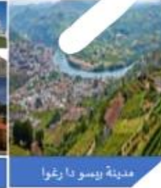
مدينة بيسو دا رغوا

1. منذ زمن بعيد كان الناس يقطعون بعض فرائج الرحلة من مدينة (بورتو) إلى مدينة (بيسو دا رغوا) الحافلة، وتغضها بالقطار بحسب التضاريس. وفي "الحافلة" التي تجرها ستة من الخيول بانتظار الركاب، وبين هرج المحتشدين حول