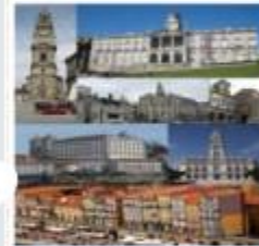
مدينة بورتو البرتغالية