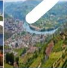
مدينة بيسو دا رغا

1. منذ زمن بعيد كان الناس يقطعون بغض مراحلي الرحلة من مدينة (بورتو) إلى مدينة (بيسو دا رغا) الحافلة، وتغصها بالقطار بحسب التضاريس. وهـ "الحافلة التي تجرها ستة من الخيول بانتظار الركاب"، وبين هرج المحتشدين حول