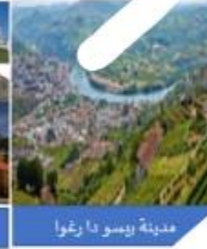
مدينة بيسو دا رغا

1. منذ زمن بعيد كان الناس يقطعون بغض فراجل الرحلة من مدينة (بورتو) إلى مدينة (بيسو دا رغا) الحافلة، وتغصها بالقطار بحسب التضاريس. وفي "حافلة التي تجرها ستة من الخيول بانتظار الركاب"، وبين هرج المحتشدين حول الحافلة، تعالت أصوات المسافرين بالشكوى من عدم اهتد إلى الأماكن التي حجزوها، أو فقدانهم أمتعتهم.