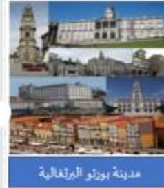
مدينة بورتو البرتغالية