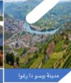
مدينة بيسو دا رغو

1. منذ زمن بعيد كان الناس يقطعون بغضّ مراحلي الرحلة من مدينة (بورتو) إلى مدينة (بيسو دا رغو) الحافلة، وتغصّها بالطيار يحسب التضاريس. وقد "الحافلة التي تجرّها سبّة من الخيول بانتظار الركاب"، بن، وبين هرج المحتشدين حول الحافلة، تعالت أصوات المسافرين بالشكوى من عدم اهتمامهم.