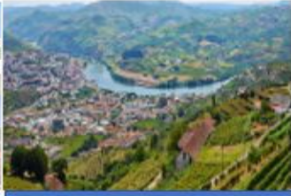
مدينة بيسو دا رغوا

1. مُنْذُ زَمَنٍ بَعِيدٍ كَانَ النَّاسُ يَقْطَعُونَ بَعْضَ مَرَاكِجِ الرِّحْلَةِ مِنْ مَدِينَةِ (بورتو) إِلَى مَدِينَةِ (بيسو دا رغوا) بِالْحَافِلَةِ، وَبَعْضَهَا بِالْقِطَارِ بِحَسَبِ التَّضَارِيسِ. وَهَفَّتِ الْحَافِلَةُ الَّتِي تَجْرُهَا سَيَّئَةٌ مِنَ الْخِيُولِ بِانْتِظَارِ الرُّكَّابِ الْمُتَأَخِّرِينَ، وَبَيْنَ هَزَجِ الْمُحْتَشِدِينَ حَوْلَ الْحَافِلَةِ، تَعَالَتْ أَصْوَاتُ الْمُسَافِرِينَ بِالشُّكْوَى مِنْ عَدَمِ اهْتِدَائِهِمْ إِلَى الْأَمَاكِينِ الَّتِي حَاجَزُوهَا، أَوْ فُقْدَانِهِمْ أَمْتِعَتِهِمْ.