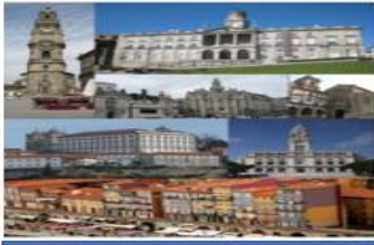
مدينة بورتو البرتغالية