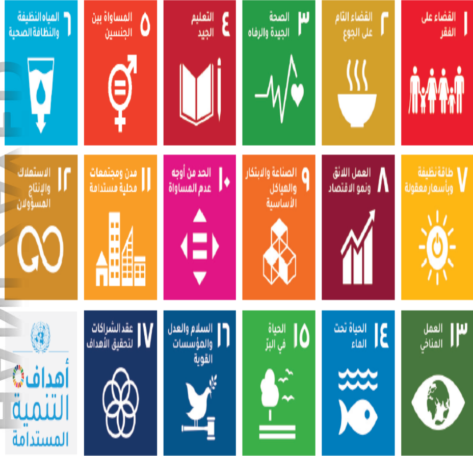
الشكل 2. أهداف التنمية المستدامة الـ 17 وفقاً لخطة التنمية المستدامة لعام 2030