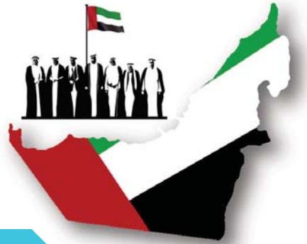
دولة الإمارات العربية المتحدة