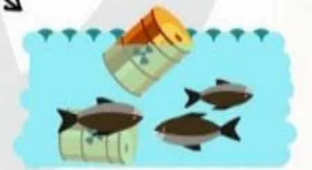
إلقاء المواد البترولية في البحر