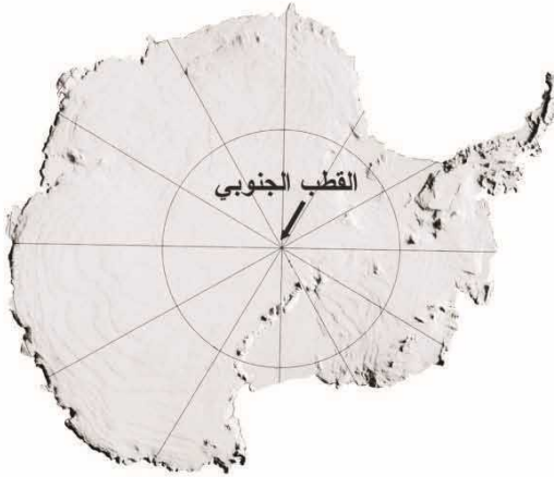
خريطة القارة الجنوبية

تقع القارة القطبية جنوب الكرة الأرضية تماما. (ولو حاول البحث عنها في مجسم الكرة الأرضية ستجدها في أسفلها.) القارة القطبية تحتل عُشر مساحة الأرض وتغطيها طبقة ثلجية يبلغ سمكها ١٥٠٠ متر أو أكثر. ويقع القطب الجنوبي في وسطها تماما. القارة القطبية هي أبرد القارات وأشدّها جفافا وارتفاعا. ورياحها أعتى الرياح على الإطلاق. القليل من الناس يعيشون هناك على مدار السنة. بينما يمكث العلماء فترات قصيرة ويسكنون محطات بحث مصممة خصيصا لذلك. يمتد فصل الصيف من شهر أكتوبر إلى شهر مارس ولا ينقطع ضوء النهار طوال تلك الفترة. بينما يحدث العكس في فصل الشتاء الذي يمتد من أبريل إلى سبتمبر حيث تغرق القارة القطبية في ظلام دائم طيلة ستة أشهر.