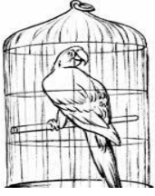
صورة رقم 2