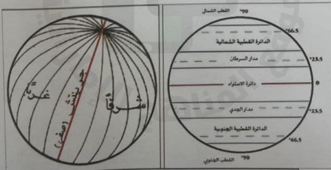
دوائر العرض وخطوط الطول

أجاب: يمكننا ذلك بكل سهولة، من خلال معرفة خطوط الطول، ودوائر العرض، "وهي عبارة عن شبكة وهمية رَسَمَهَا العلماء على نموذج الكرة الأرضية، بهدف تحديد الأماكن بدقة علمياً" ردد بقية الرحالة: شكراً لك لقد أنقذتنا، هيا بنا نبحث عن موقع خيمتنا واتجاه الطريق إليها.