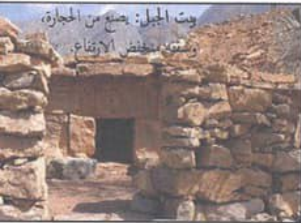
بيت الجبل: يصنع من الحجارة، ويستعمل منخفض الارتفاع.