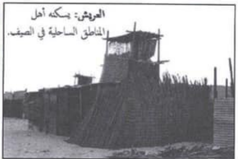
العريش: يسكنه أهل المناطق الساحلية في الصيف.