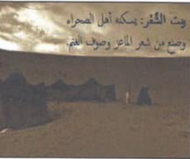
بيت الشعر: يسكنه أهل الصحراء يصنع من شعر الماعز وصوف الغنم.

ولاً: حلل الصور التالية والمعلومات المصاحبة، ثم أجب عما يلجا من أسئلة باختيار الإجابة المناسبة من بين البد