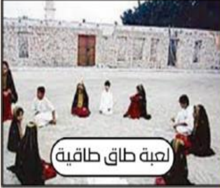
لعبة طاق طاوية