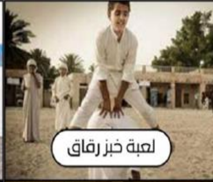
لعبة خبز رفاق