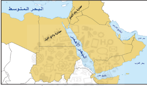
خريطة حضارات الوطن العربيّ