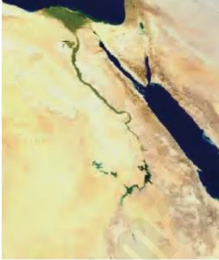
صورة جوية لوادي النيل

تمركزت في وادي النيل، وهو وادٍ ضيقٌ يمتدُّ من أسوانَ إلى رأس الدلتا بالقرب من القاهرة، حيثُ المياهُ المتوقِّرة والأراضي الخصبة الواسعة. اهتمَّ المصريونَ بتنشيطِ الزراعةِ في بلادهم وتنظيمِ الرِّيِّ، فاستخدموا الشادوفَ، وهو وسيلةٌ لرفعِ الماءِ من النَّهرِ، كما استخدموا وسائلَ متنوعةً كالمنجلِ والمِحراثِ. أتجتُّ مصرُ محاصيلَ زراعيَّةٍ شملتِ القمحَ والشَّعيرَ والعنبَ والتَّخيلَ والكتَّانَ، كما اهتمَّوا بالتَّقويمِ وعلمِ الفلكِ، وجمعوا الأشهرَ في ثلاثةِ فصولٍ، وهي (الفيضانُ، البذرُ، الحصادُ).