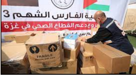
صورة 1 المساعدات الصحية التي قدمتها الإمارات لغزة