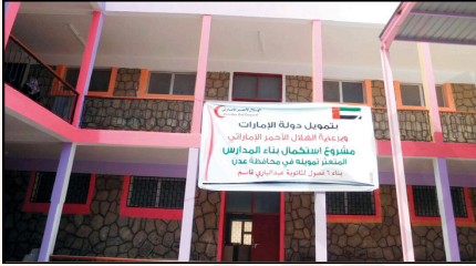
صورة 2 المساعدات التي قدمتها الإمارات لليمن