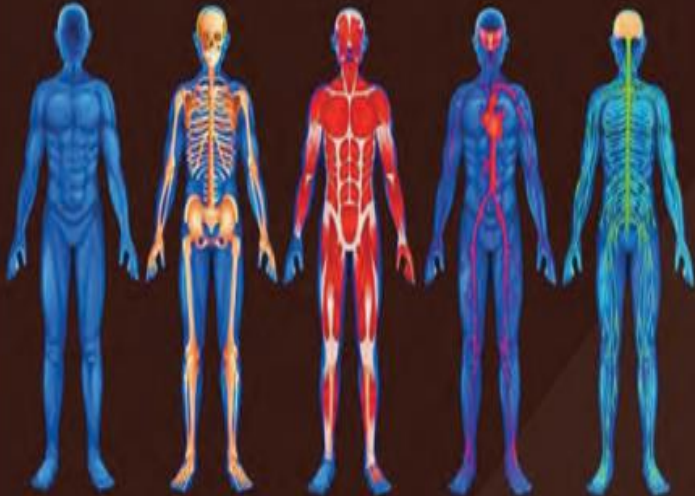
الجهاز العصبي الطب و الشرايين الجهاز العضلي الهيكل العظمي الجهاز الهوائي