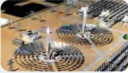
مجمع محمد بن راشد آل مكتوم للطاقة الشمسية