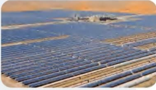
محطة شمس 1 في أبوظبي