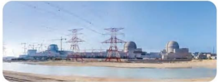
محطة بركة للطاقة النووية - أبوظبي

وأعلنت مؤسسة الإمارات للطاقة النووية في أغسطس 2020م عن نجاح تشغيل الوحدة الأولى من محطة «بركة» للطاقة النووية السلمية التي ستكون الأولى في الوطن العربي.