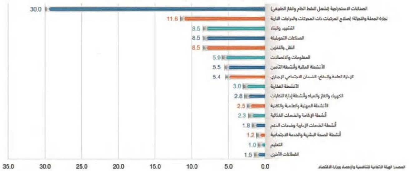
التوزيع القطاعي للناتج المحلي الإجمالي بالأسعار الثابتة لعام 2018، (%)

• أستخرج من الرّسم البيانيّ السّابق حقيقتين حول مساهمة القطاعات غير النفطية في الناتج المحليّ الإجماليّ: