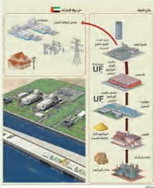
محطة بركة للطاقة النووية - أبوظبي