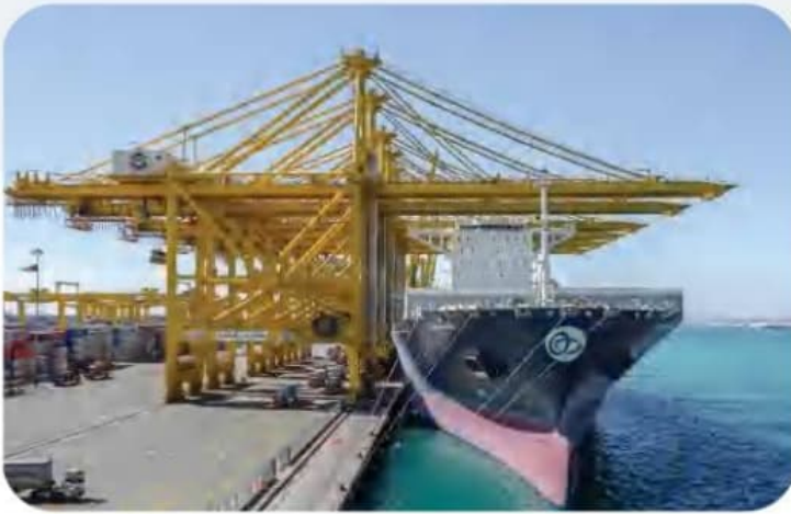
ميناء جبل علي - دبي

يعتبر ميناء جبل علي أكبر ميناء بحري في منطقة الشرق الأوسط، والمنشأة الرائدة ضمن موانئ دبي العالمية التي تضم أكثر من 65 ميناء ومحطة بحرية تتوزع على قارّات العالم الست، وبفضل موقعه الاستراتيجي في دبي وعلى مفترق طرق التجارة الذي يُعتبر مركزًا متكاملًا مُتعدّد وسائل النقل البحري والبرّي والجوّي لتصدير واستيراد البضائع المختلفة.