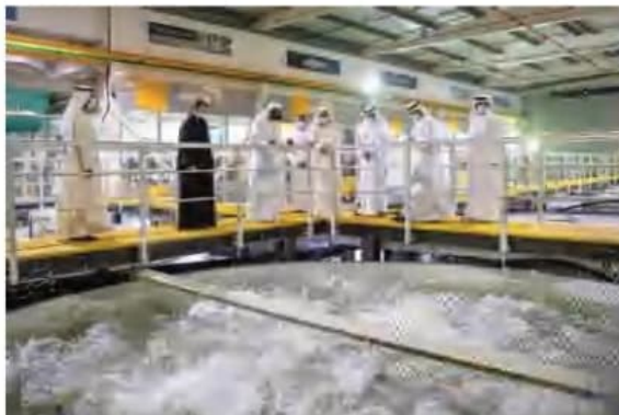
صاحب السمو الشيخ محمد بن راشد آل مكتوم - رعاه الله - خلال زيارته إلى مزرعة "فيش فارم" بدبي .