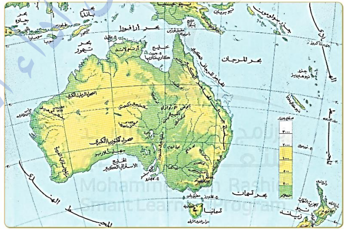
خريطة أستراليا الطبيعية