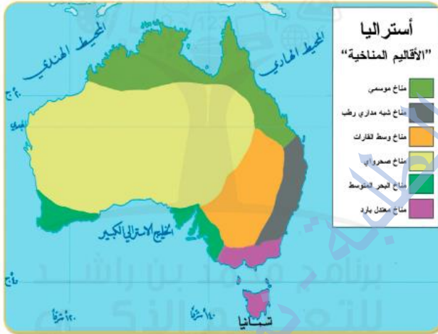
خريطة الأقاليم المناخية في أستراليا