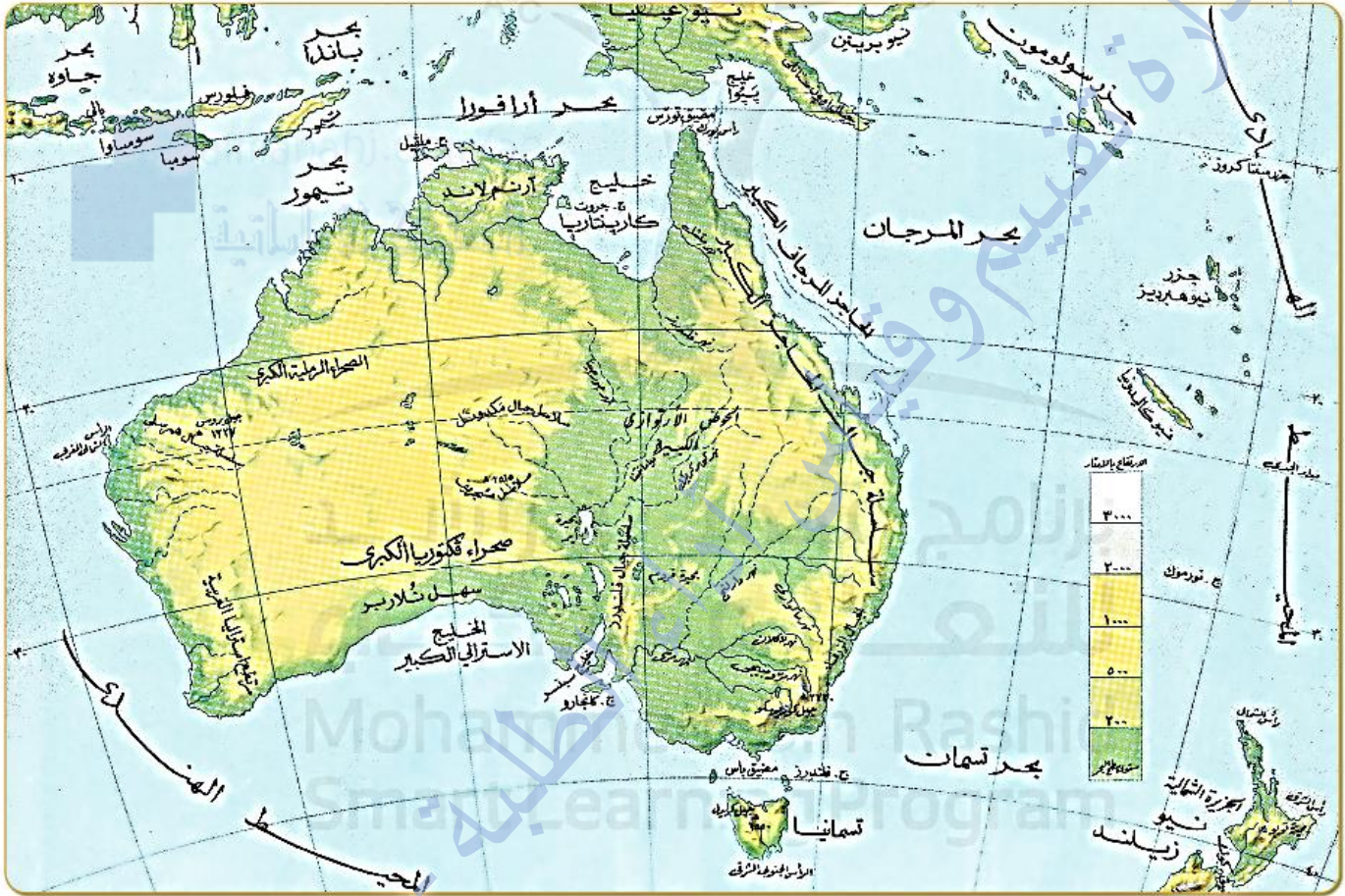
خريطة أستراليا الطبيعية

ثالثاً: أقرأ الخريطة الطبيعية لقارة أستراليا بتمعن، ثم أجب عن الأسئلة التالية: