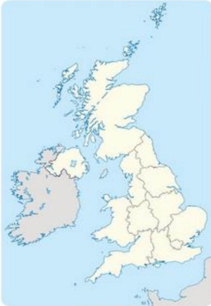
خريطة بريطانيا الصماء