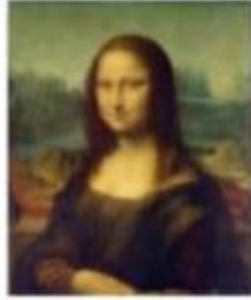
لوحة لموناليزا (الجيوكوندا)

⊙ أربط بين لصورتين في كلِّ ممَّا يلي ثمَّ أستخلص حقيقة تاريخية، وأدونها في الفراغ الذي يليهما: