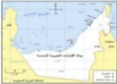
دولة الإمارات لعربية لمتحدة

الحقيقة التاريخية: لوحة الموناليزا (الجيوكوندا) من ابداعات الفنان ليوناردو دافنشي