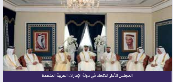
المجلس الأعلى للاتحاد في دولة الإمارات العربية المتحدة

4 شأنها شأن البلدان والدول الأخرى، تحكم دولة الإمارات العربية المتحدة بحكومة تم تشكيلها بموجب الدستور. اقرأ النص التالي عن المجلس الأعلى للاتحاد ثم أجب عن الأسئلة التالية.