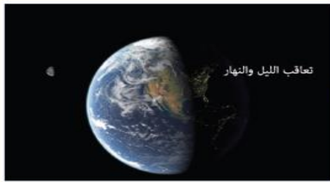
تعاقب الليل والنهار

1 تعاقب الليل والنهار في نظام دقيق وبديع لا يختل.