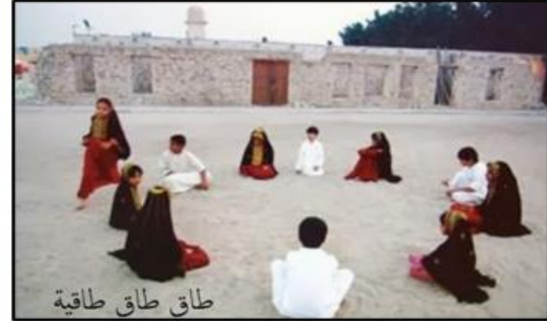
طاق طاق طاقية