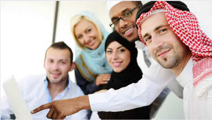
حقوق الطبع © محفوظة لوزارة التربية والتعليم - دولة الإمارات العربية المتحدة

إضافةً إلى ذلك، اقترح الإطار المرجعي الأوروبي للكفاءات الأساسية للتعلّم المستدام ضرورة مساعدة الشباب في تطوير كفاءتهم الاجتماعية والمدنية، المحددة على أساس المعرفة والمهارات والسلوكيات، أثناء تعليمهم المدرسي. يدعو هذا النهج المرتكز إلى الكفاءة إلى اتباع أساليب جديدة لتنظيم عملية التربية على المواطنة وتعليمها.