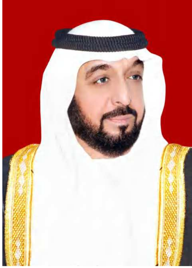
صاحب السمو الشيخ خليفة بن زايد آل نهيان رئيس دولة الإمارات العربية المتحدة، حفظه الله

"يجب التزوّد بالعلوم الحديثة والمعارف الواسعة والإقبال عليها بروح عالية ورغبة صادقة، حتى تتمكن دولة الإمارات خلال الألفية الثالثة من تحقيق نقلة حضارية واسعة."