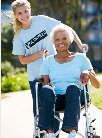
حقوق الطبع © محفوظة لوزارة التربية والتعليم - دولة الإمارات العربية المتحدة