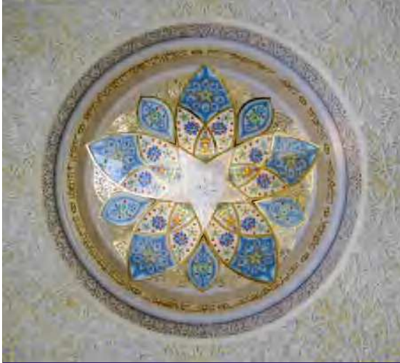
مستوحى من جامع الشيخ زايد الكبير، أبوظبي

تصميم يعكس مفاهيم الثقافة المحلية والمجتمع المعاصر والمواطنة العالمية