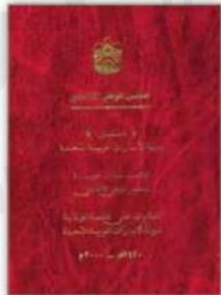
دستور دولة الإمارات العربيّة المتّحدة

من واجبي تجاه وطني العمل والجد والاجتهاد والمثابرة من أجل رفعة بلادي.