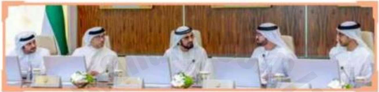
اجتماع مجلس الوزراء بدولة الإمارات العربية المتحدة

منذ إصدار دستور دولة الإمارات العربيّة المتّحدة كانت هناك موجهات وأمور لا بدّ من أخذها في الاعتبار، وهي الأمور التي تبرز وتبيّن شخصيّة الدّولة الاتّحادية أو ما نسقيه باتّجاهات الدّستور العامّة، ومن أهمّها: