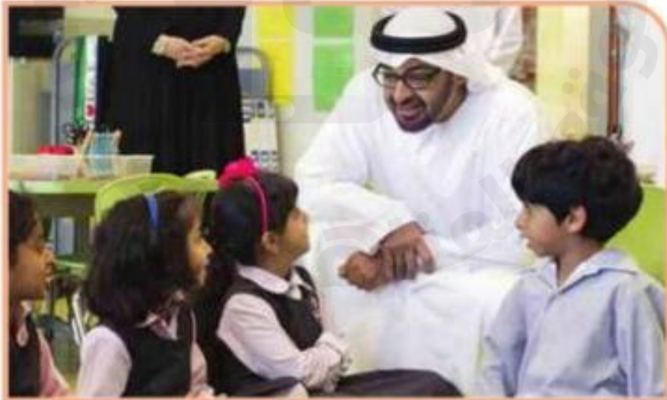
صاحب السمو الشيخ محمد بن زايد آل نهيان رئيس الدولة القائد الأعلى للقوات المسلحة - حفظه الله - خلال زيارة لإحدى مدارس الدولة.

6 تقدير العمل كركن أساس من أركان تقدم المجتمع.