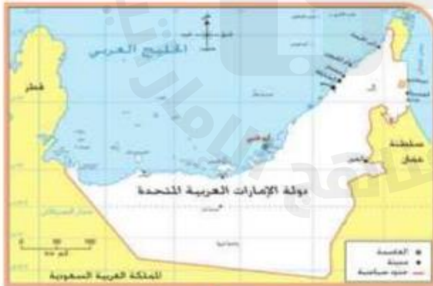
خريطة دولة الإمارات العربية المتحدة

عنى دستور دولة الإمارات العربيّة المتّحدة بالاتّجاهات الوطنيّة لدعم الاتّحاد والحفاظ عليه ومن أهمّها: