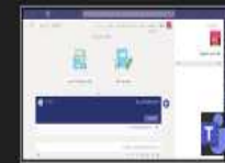
عامة (نكتب اسم المجموعة) |...