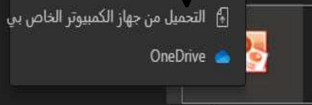
.. PowerPoint - نسخة - تيمز -