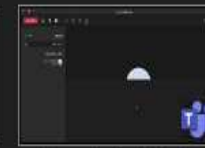
اجتماع القناة الجديدة | eams.