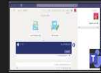
عامة (نكتب اسم المجموعة) |...