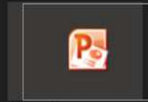
تيمز - نسخة - PowerPoint ..