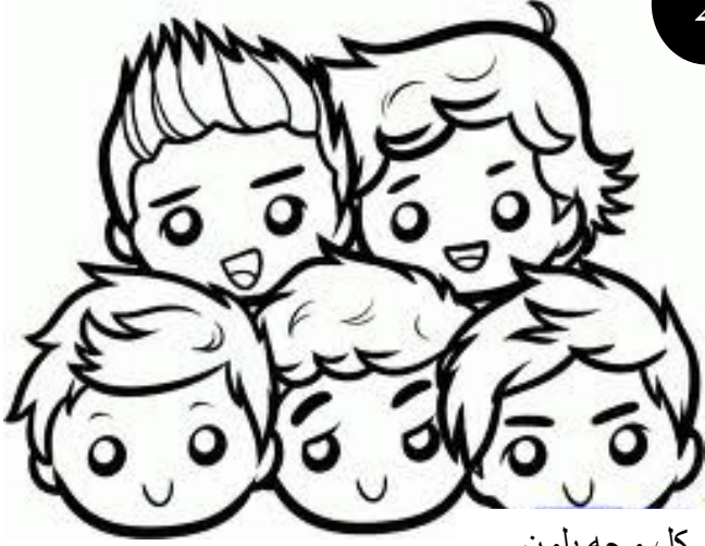
كل وجه بلون