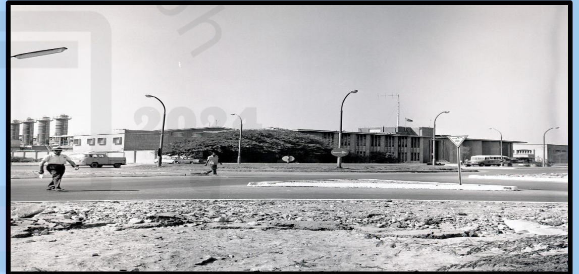
محطة كهرباء الجفير