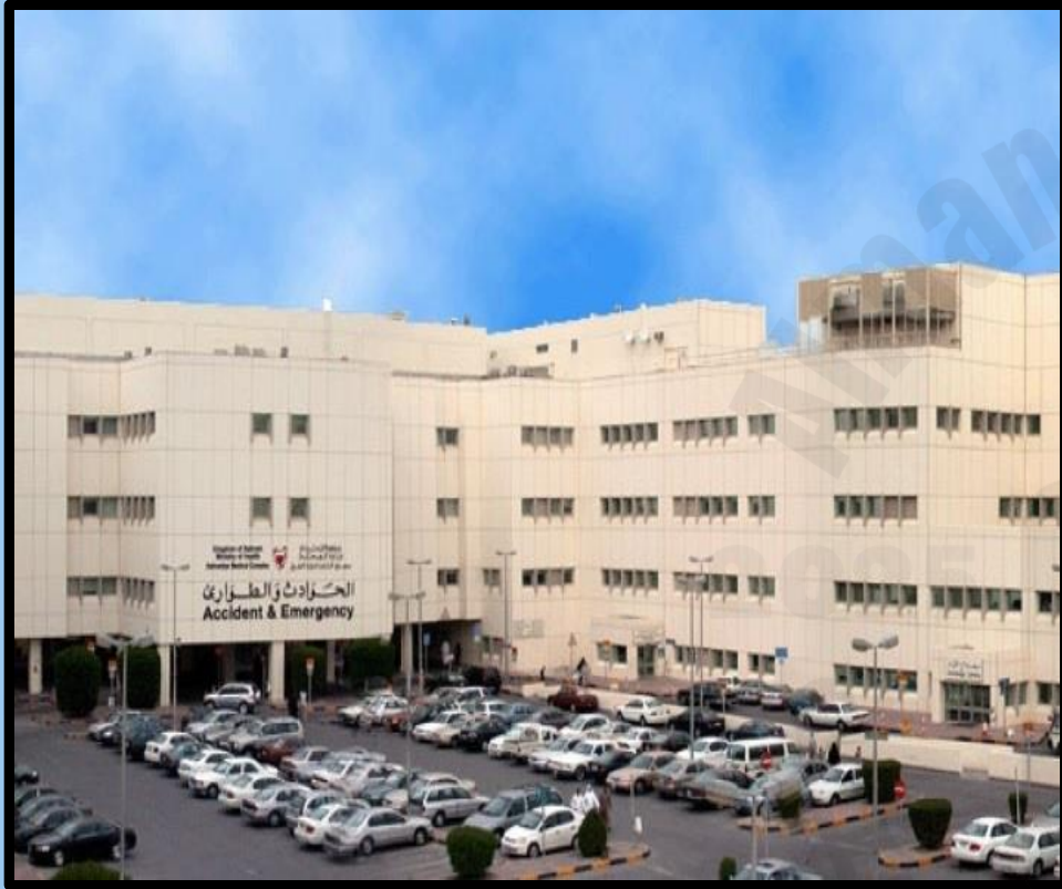
مستشفى السلمانية الطبي