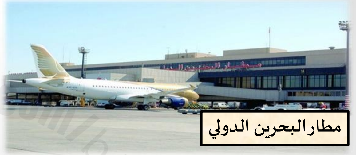
مطار البحرين الدولي