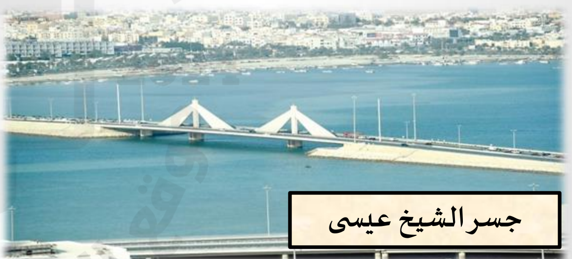
جسر الشيخ عيسى