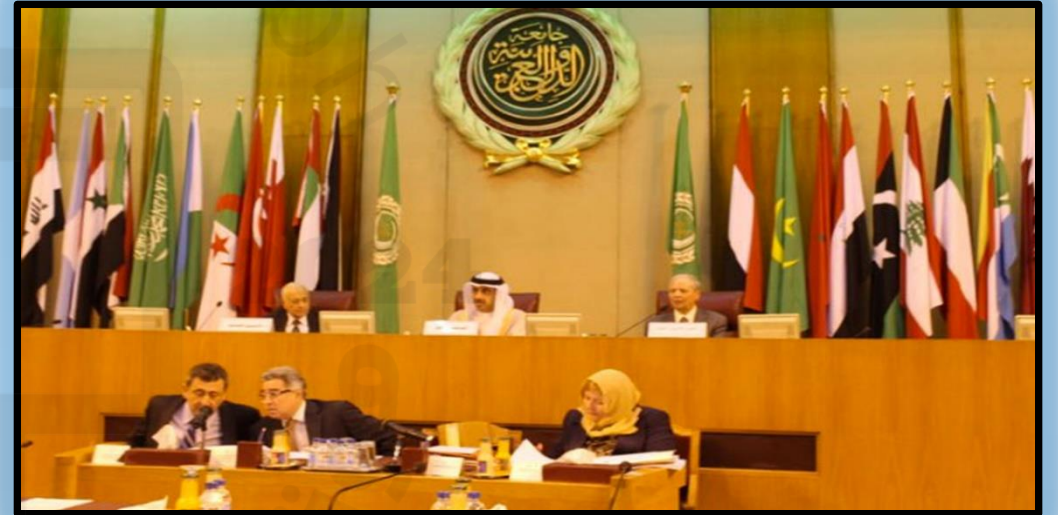
جامعة الدول العربية