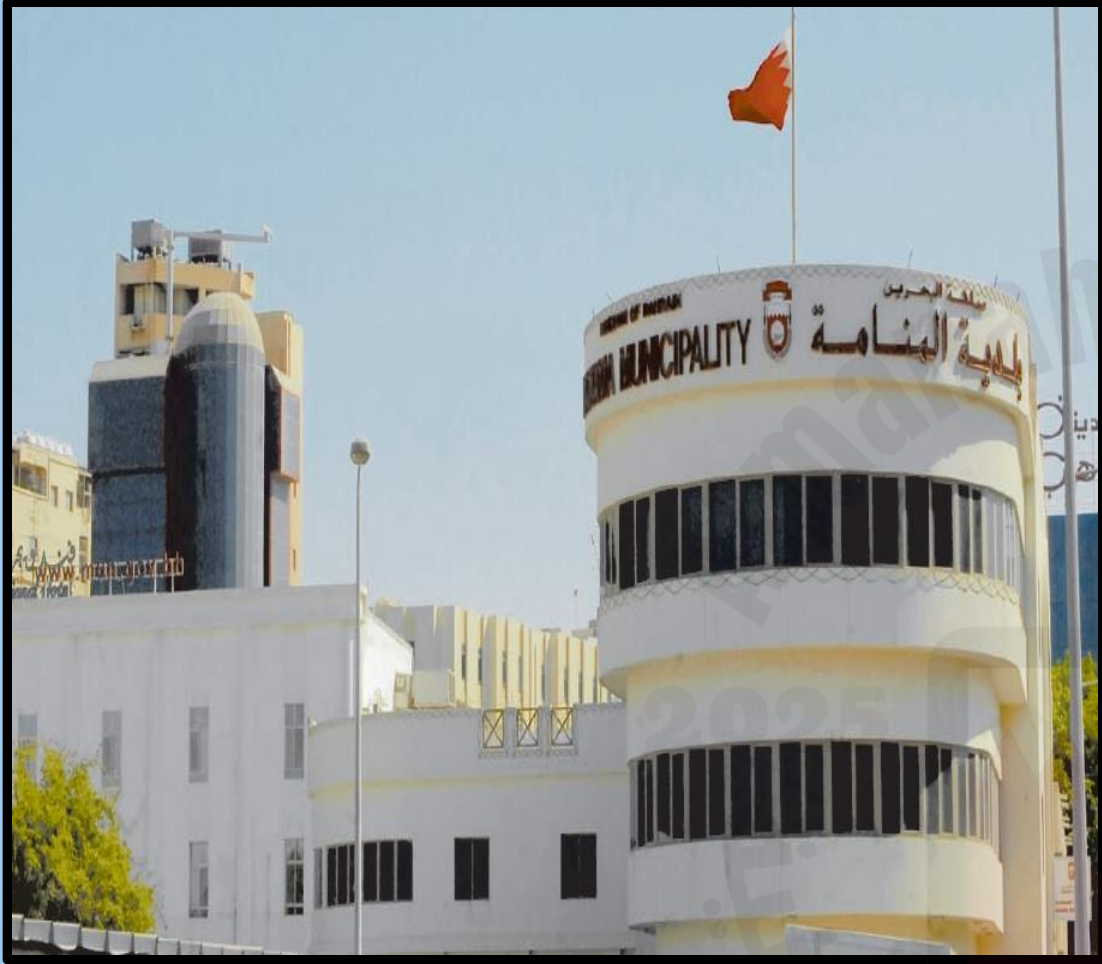
أول بلدية في المنامة