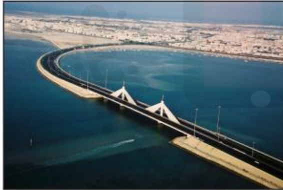
جسر الشيخ عيسى بن سلمان.