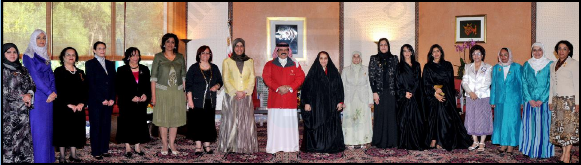
أعضاء المجلس الأعلى للمرأة مع جلالة الملك المفدى حمد بن عيسى آل خليفة