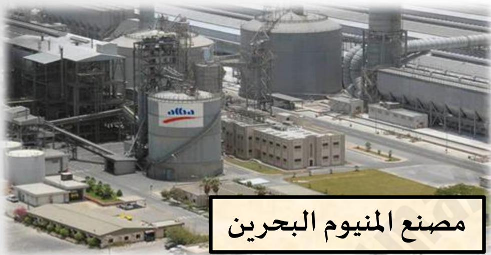
مصنع المنيوم البحرين