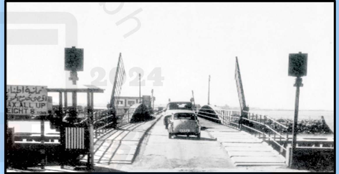
جسر الشيخ حمد