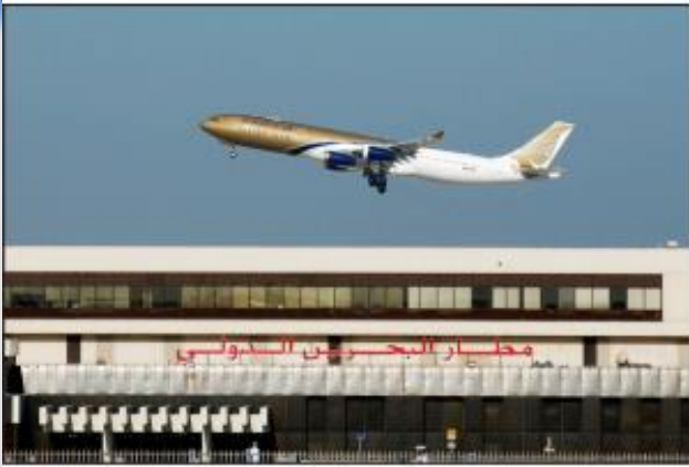
مطار البحرين الدولي.