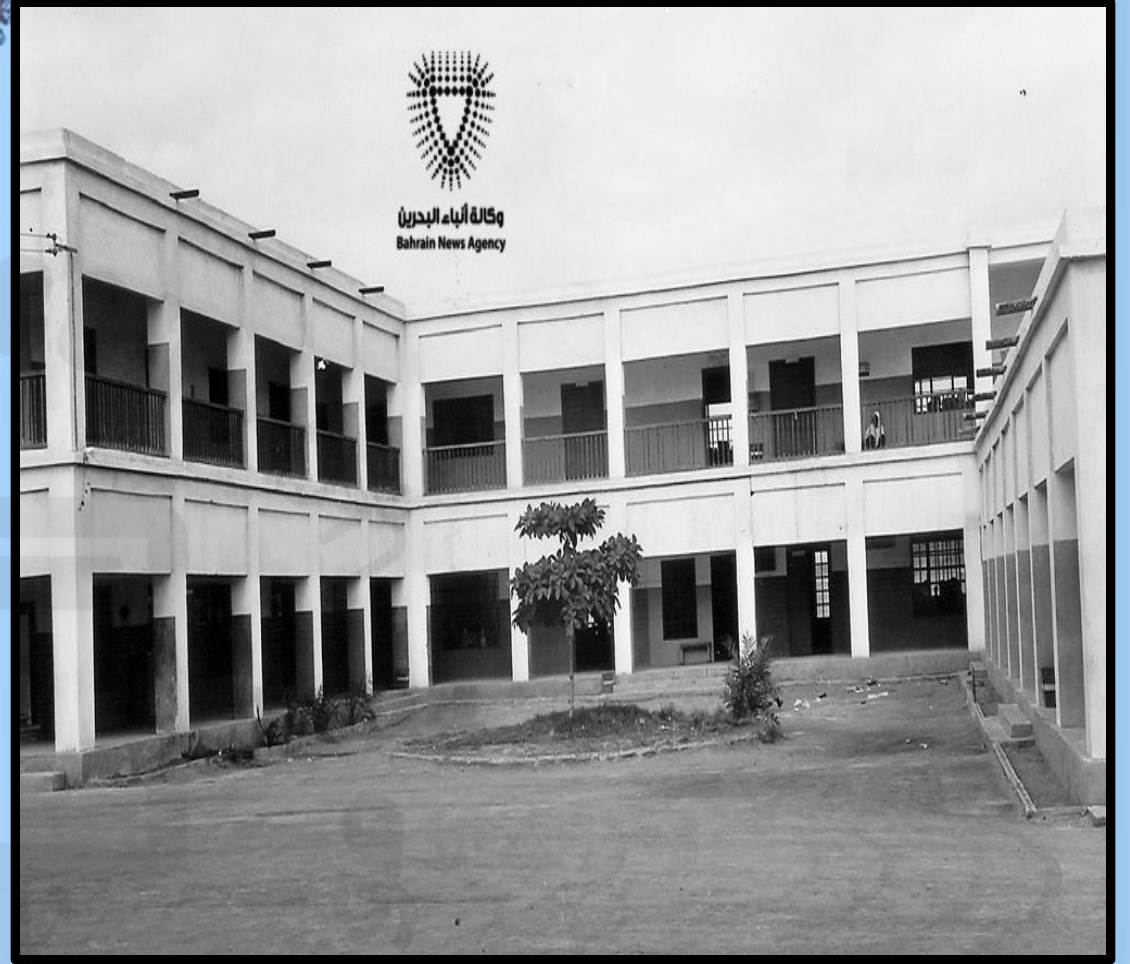
أول مدرسة للبنين (الهداية الخليفية)