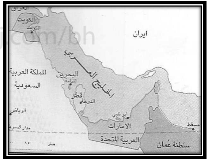
خريطة منطقة الخليج العربي