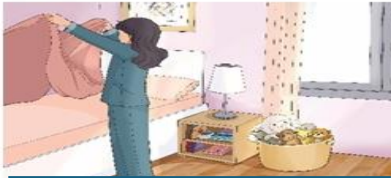
مساعدة والدي في تنظيف المنزل