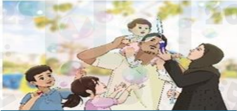
المشاركة في الأنشطة الأسرية