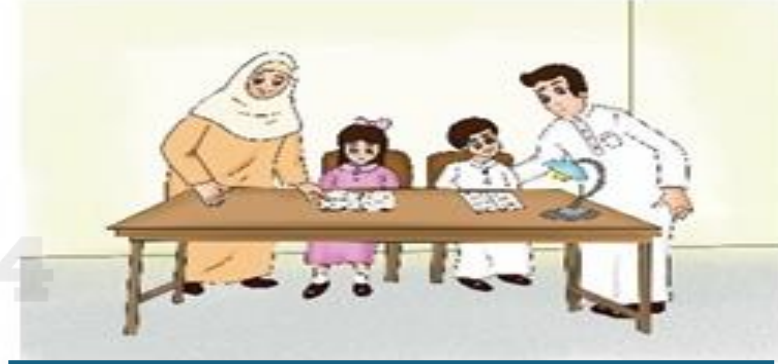
احترام الوالدين وطاعتهم وتقديرهم