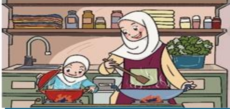
مساعدة والدي في إعداد الطعام