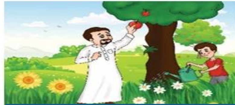
مساعدة والدي في الأعمال المنزلية