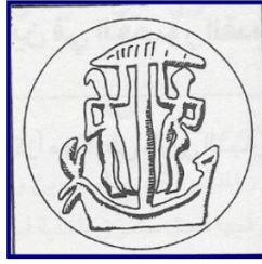
2- ختم دلموني