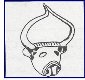
ج4- 1- من الآثار الدلمونية