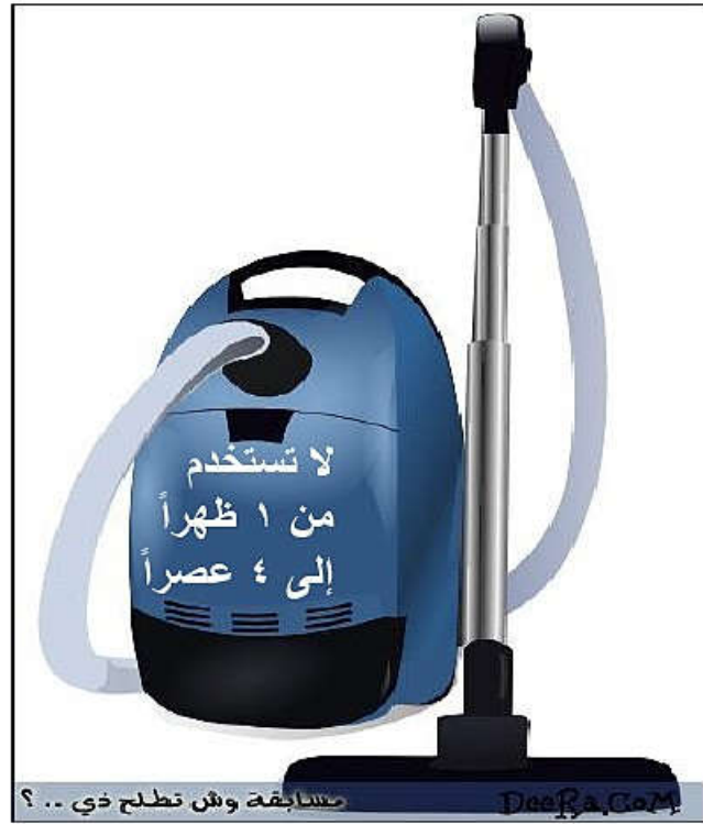
الجهاز رقم (١) .....