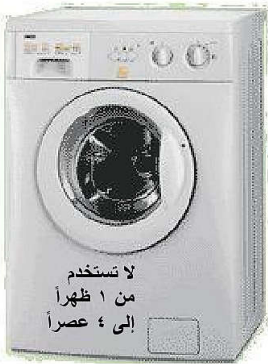
الجهاز رقم (٢) .....

السؤال السابع: لاحظ الصور التالية وأجب عما يليها من أسئلة: