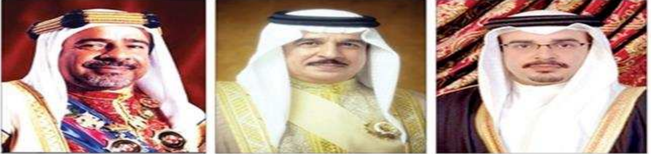
تمنذج الصور الملكية المعتمدة من قبل الديوان الملكي