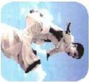
نبذة عن الشاعر

شاعر مصري كبير اطلق عليه قصائد ومسرحيات اطفال تطلب على شجرة نيرة الصبح والارشفه عشق في مصر وسورية وبنان وقسمين.