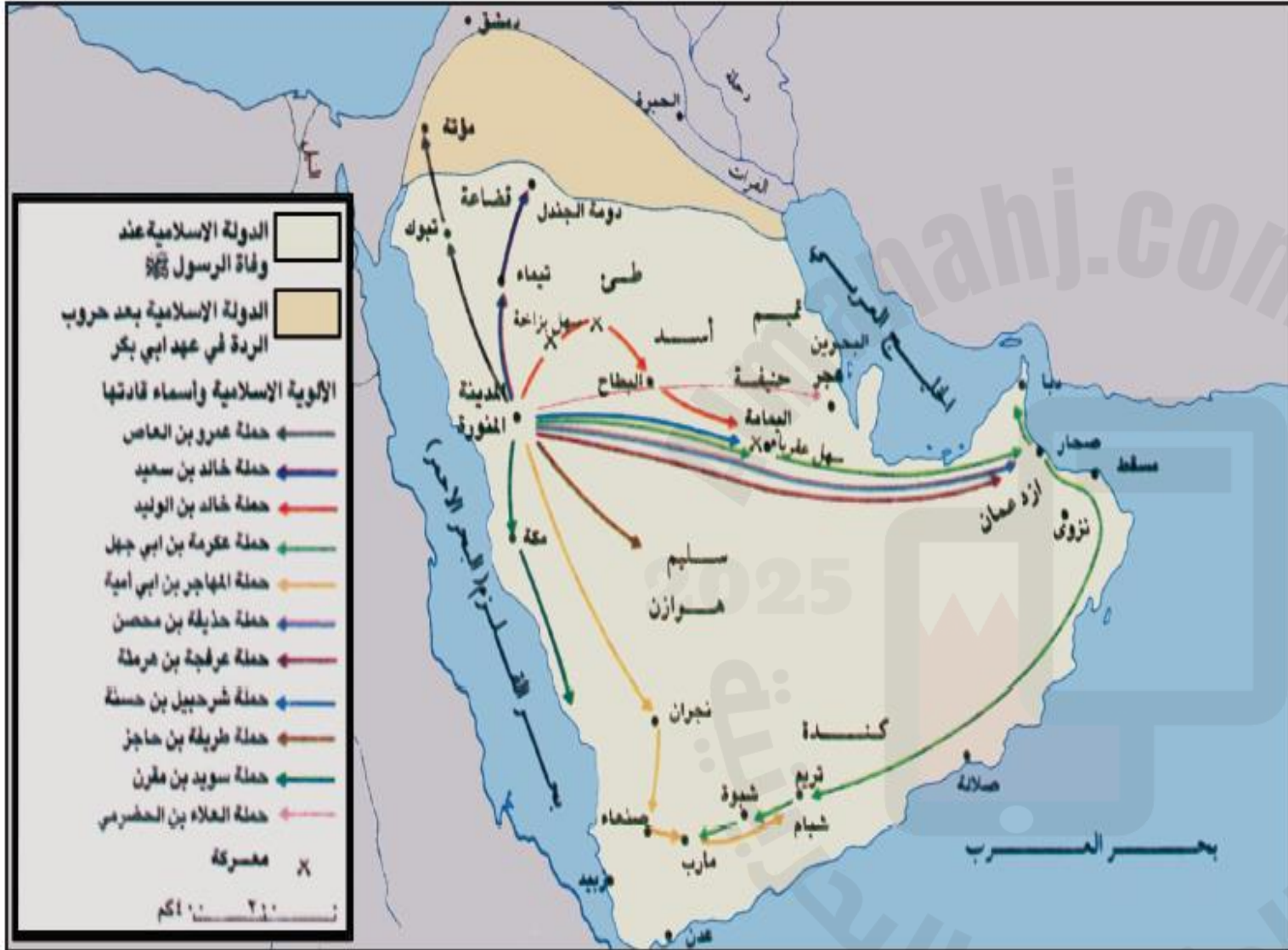
1. خريطة حروب الردة في عهد أبي بكر الصديق (11-13 هـ).