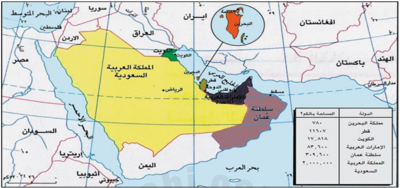
مستند ١ خريطة دول مجلس التعاون السياسية