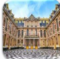
Le Château de Versailles قصر فيرساي