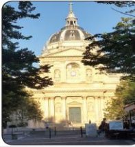
La Sorbonne السوربون