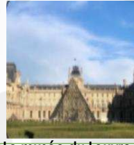
Le musée du Louvre متحف اللوفر