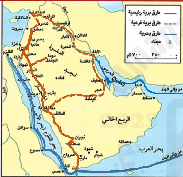
مستند (٢) طرق التجارة قديما