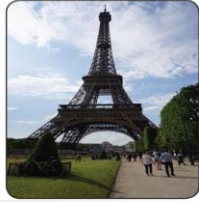
La Tour Eiffel برج ايفل