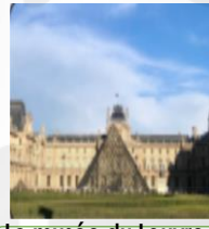
Le musée du Louvre متحف اللوفر