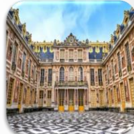
Le Château de Versailles قصر فيرساي