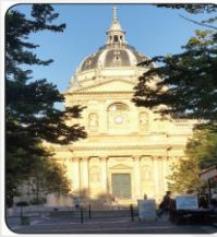
La Sorbonne السوربون