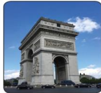
L'Arc de triomphe قوس النصر