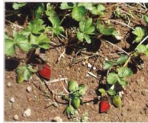
استنتج كيف تكون المادة الوراثية في نباتات الفراولة الصغيرة مقارنة بنباتات الفراولة الأصلي؟