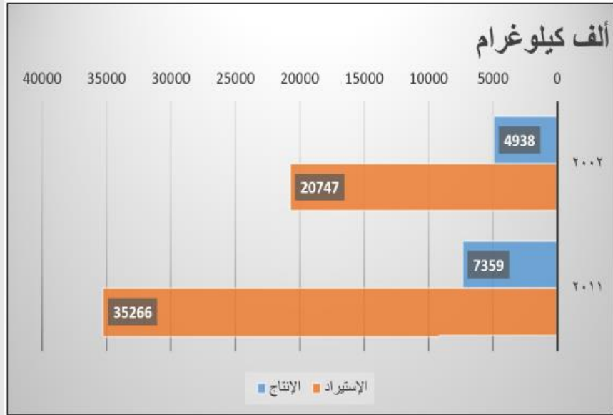
إنتاج وإستيراد الدجاج