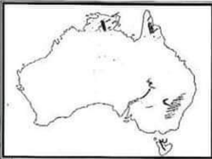
٣- نهر الاورينوكو

ملحوظة : الاجابة مباشرة ولن يؤخذ باى حل اخر