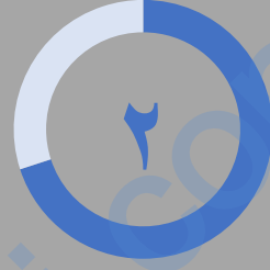
جناس غير تام

هو اتفاق بين لفظتين في الحروف ولكنه اتفاق غير كلي مع اختلافهما في المعنى.