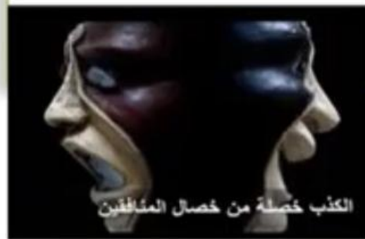
الكذب خصلة من خصال المنافقين