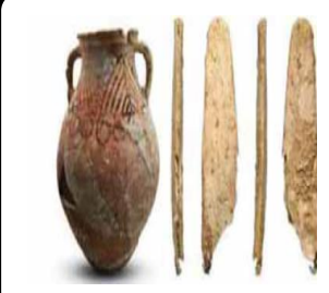
مكتشفات حجرية وفخارية قديمة