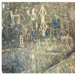
بعض الرموز والنقوش العمانية القديمة

السؤال الخامس : ماذا تمثل لك الصور التالية .