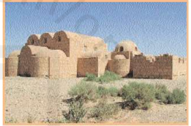
قصر عمرة بالأردن