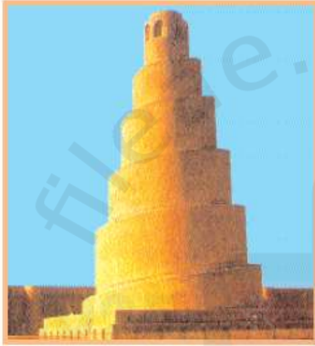
مئذنة المسءء الجامع بسامراء (العراق)

على استخدام الاعمدة وتيجانها والقوس الذي يشبه حدة الحصان واستخدام الاحجار القائمة في البناء على شكل طبقات واستعمال الكتابة والزخارف الملونة