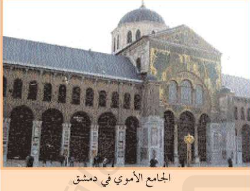
الجامع الأموي في دمشق