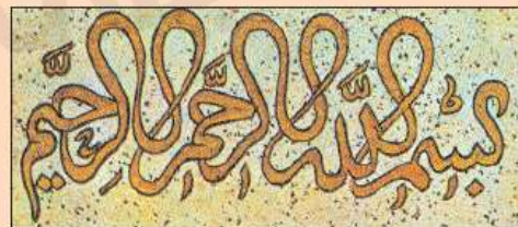
نماؤ من استخدام الءط الإسلامي في الزخرفة