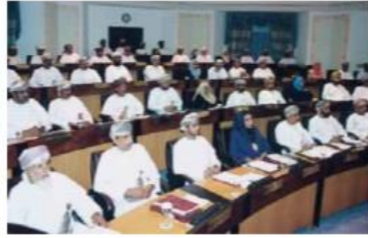
احد اجتماعات مجلس الدولة