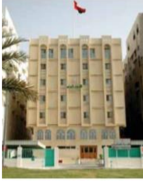
مبنى الادعاء العام

الادعاء العام : هو جزء من السلطة القضائية وهو ممثل للهيئة الاجتماعية في تولي الدعوى العمومية إذ ينوب عن المجتمع في اقتضاء حقه في عقاب من يرتكب أي فعل مخالف للقانون . كما يشرف على شؤون الضبط القضائي ويسهر على تطبيق القوانين الجزائية وملاحقة المذنبين وتنفيذ الأحكام. ويقوم بكافة الإجراءات المقررة قانوناً في سبيل كشف الحقيقة سواء بإجراء التحقيق أو اتخاذ الإجراءات التحفظية التي تقيد القانون.