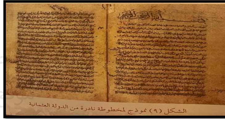
الشكل (٩) نموذج لمخطوطة نادرة من الدولة العثمانية